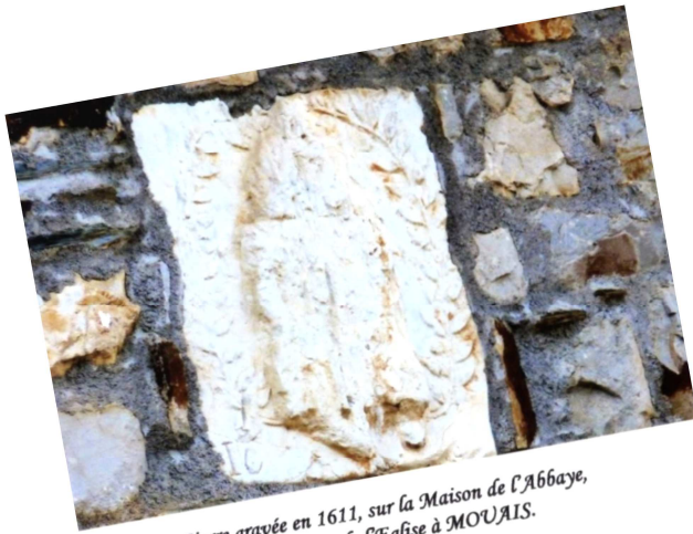
Pierre gravée en 1611, sur la Maison de l'Abbaye, située place de l'Eglise à MOUAIS.