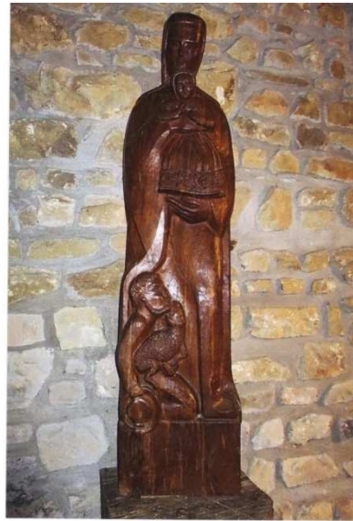
Sainte Anne avec Nicolazic Sculpture en bois réalisée par Alain DOUILLARD, en 1952